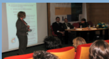
Terceiro Painel de Oradores. Tema: "A Certificação do Sistema de Segurança Alimentar"