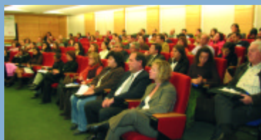
Panorama Geral da Plateia