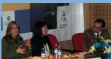
Segundo Painel de Oradores. Tema: " O Sistema HACCP Aplicado nas Grandes Superfícies"