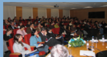
Panorama Geral da Plateia