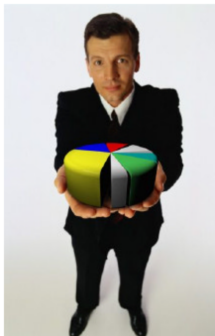
Imagem utilizada na promoção do evento