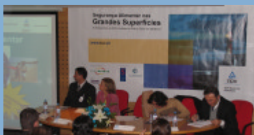
Primeiro Painel de Oradores. Tema: " Os novos Regulamentos Comunitários"