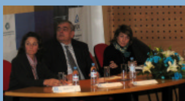
Quarto Painel de Oradores. Tema: " Qualificação e Avaliação de Fornecedores"